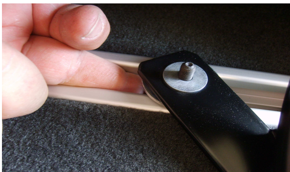
Montera grindens fäste mot skruvbrickan