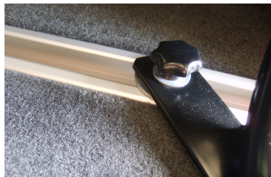
Skruva åt med medföljande stjärnvred