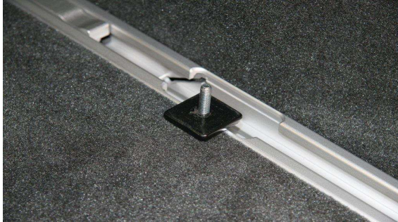
Lägg brickan med skruv i spåret