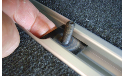
Håll upp brickan med ett finger